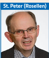
St. Peter (Rosellen)

Kontakt: (0162) 2068884 renovat.nyandwi @erzbistum-koeln.de