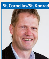
St. Cornelius/St. Konrad

Kontakt: (0162) 2069181 alexander.neuroth @erzbistum-koeln.de